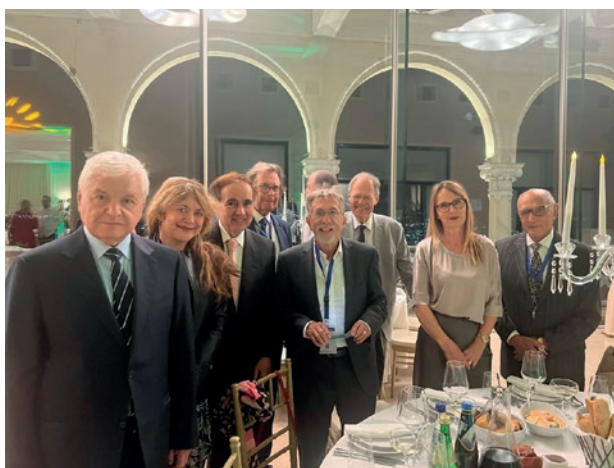
Рисунок 2. Эксперты XX Всемирного конгресса по репродукции человека.