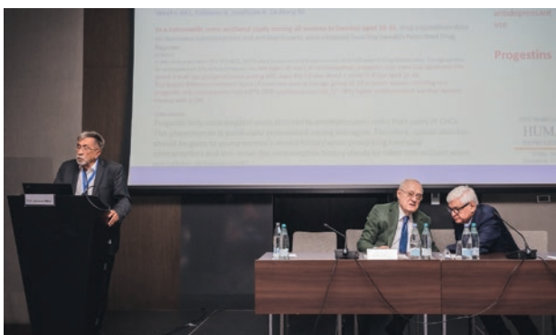
Рисунок 5. Профессор Й. Битцер, профессор А. Хомасуридзе, академик РАН, д.м.н., профессор А.Д. Макацария.

Figure 4. Cathedral of the Georgian Orthodox Church Tsminda Sameba (Holy Trinity).